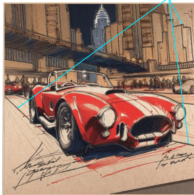
Przykładowy obraz PaintSonic z grawerem laserowym